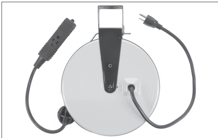
Electrical Rating - All models use 125 Volts 60 Hz

CAUTION - TO REDUCE THE RISK OF ELECTRIC SHOCK AND FIRE - PULL PLUG WHEN SERVICING, OR WHEN RE-LAMPING - USE ONLY 13 WATT OR SMALLER BULB