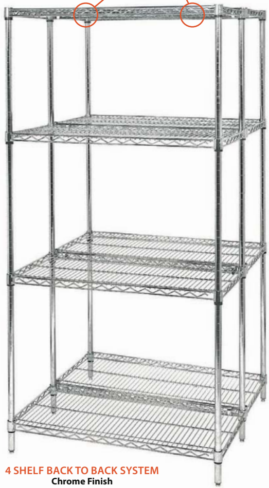
4 SHELF BACK TO BACK SYSTEM Chrome Finish

S-HOOKS For continuous runs of shelving. Two hooks should be placed per shelf where two posts are not utilized.